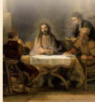
Rembrandt Harmensz van Rijn (1606-1669), De Emmaüsgangers (Les pèlerins d'Emmaüs), 1648, Parijs, Musée du Louvre